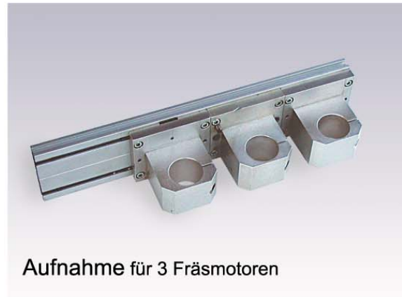
Aufnahme für 3 Fräsmotoren